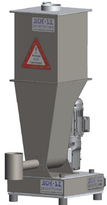
MONO+ mit 36-Liter-Trichter und vertikalem Austragrohr auf Plattformwaage BASIC400